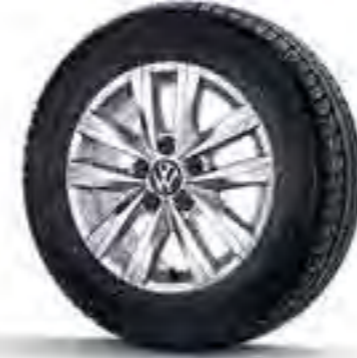
01 Highline 17" Woodstock alüminyum alaşımli jant