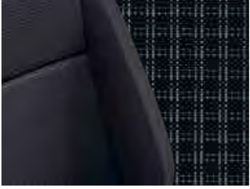
"Circuit" koltuk kumaşı